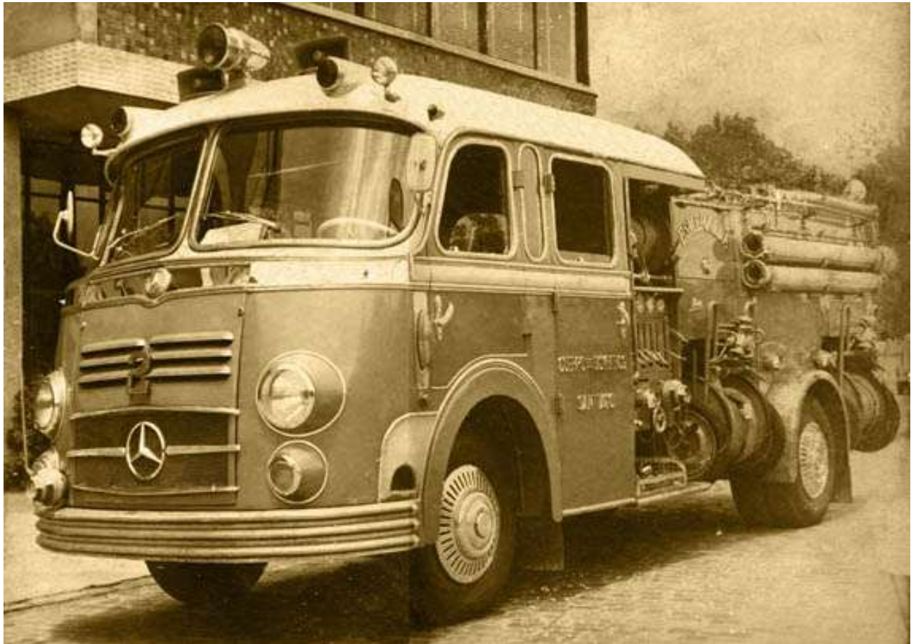
Bomba Mercedes Benz metz 1956, Alemania Permanecio en servicio: 21 años, 8 meses, 23 días.

Estanque 900 litros de agua. Estanque de espuma 180 litros. Turbina Metz, 38 tiras de 72 mm; 20 de 52 mm, distribuidos en cuatro "pollos" y cajoneras interiores dos carretes de primeros auxilios de 30 metros cada uno. Un piton monitor de 72 mm, una escala de lápiz, dotación del personal: 15 voluntarios.