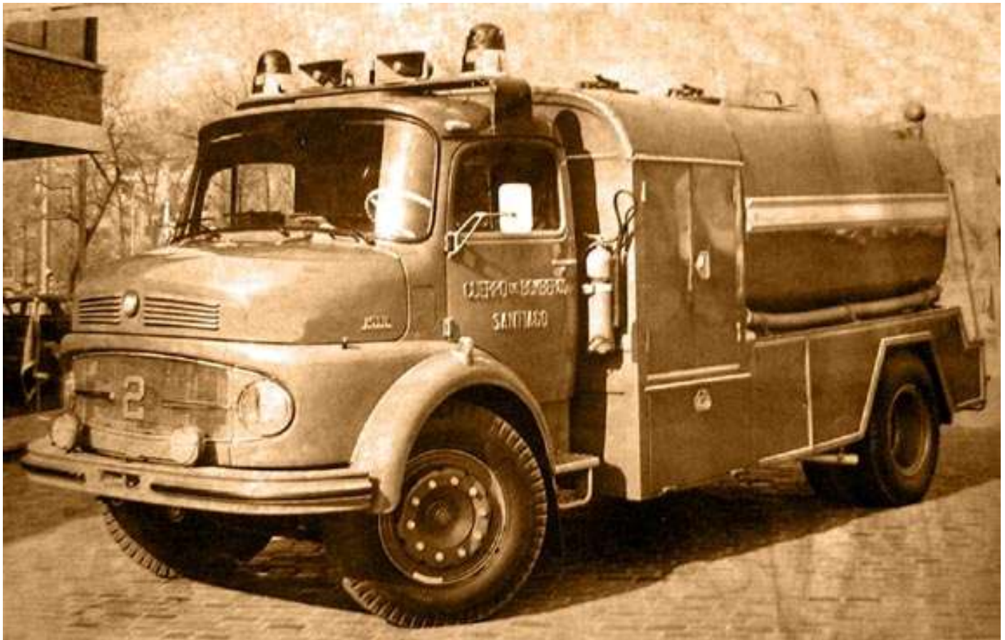
Carro Cisterna MERCEDES BENZ TIPO 1513, Construido por la Firma BISELLI S. A. VIATURA EQUIPAMENTOS INDUSTRIAS - 1976. actualmente se encuentra en servicio en nuestro cuartel, en un futuro no muy lejano sera reemplazado por otro Cisterna.

Estanque 8,500 litros de agua. tenía una motobomba Coventry - Climax Godiva con capacidad de rendimiento de 250 galones por minuto, chorizos y tiras de 72 mm. Para una mejor labor de apoyo., dotación del personal: 2 voluntarios.