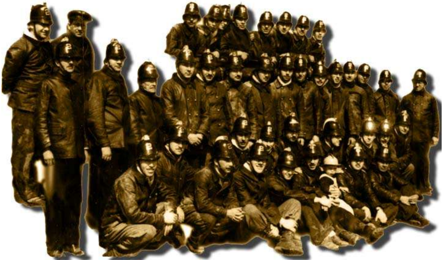
Voluntarios Segundinos en Ejercicio de Compañía en la decada del 40.

* La cotona de cuero se entrego a los voluntarios activos en un principio y luego a los honorarios con cargo de devolución al momento de retirarse del Cuerpo. Esta prenda ayudo a aliviar al personal, en cuanto lo previene del agua y a la buena conservación de la cotona de paño.