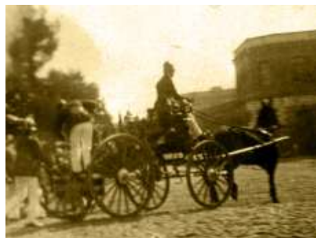
Gallo Portamangueras "Guillermo Matta" Alta: 1863 Baja: 1918

Los restos de este gallo, se encuentran en el cuartel.