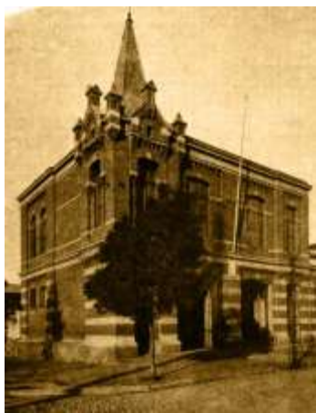
Antiguo Cuartel construido en el año 1900 y reconstruida la salida del material mayor en el año 1906. Este Cuartel fue demolido en el año 1963.

Por fin, después de tantos padecimientos, el año 1901 la segunda ocupaba su cuartel de Av. Recoleta esquina de Av. Santa María , terreno donado por la I. Municipalidad de Santiago, donde permanece hasta nuestros días, ofreciendo un adecuado abrigo al Material Mayor y una agradable permanencia tanto a los Voluntarios honorarios y activos.