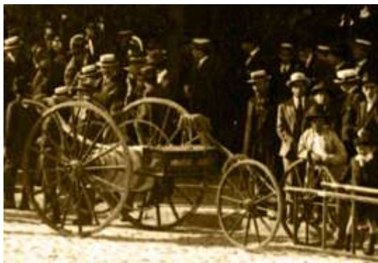
Gallo Portamangueras "Ambrosio Rodriguez" Alta: 1863 Baja: 1918

La Compa1a alcanzo a usar cinco gallos hasta el a1o 1918. Dos de ellos, fundadores, eran arrastrados a mano (uno de estos fue acondicionado para arrastrarlo con caballo montado).