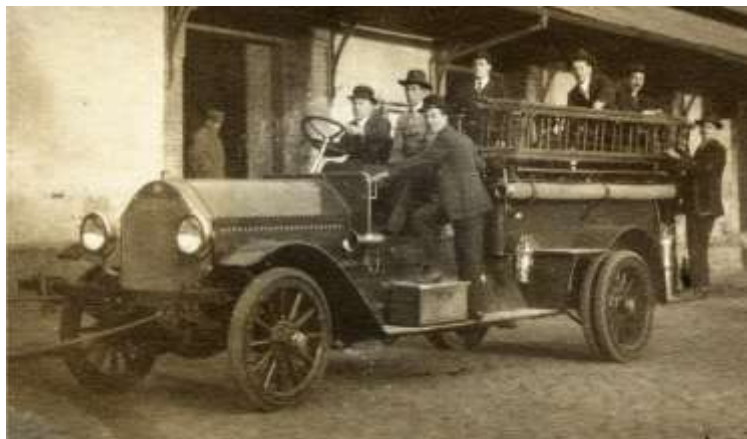
Bomba Automóvil SEAGRAVE AND COMPANY "TULIO OVALLE" Alta: 30 de Septiembre de 1917 Baja: 15 de Agosto de 1923. fué vendido al Cuerpo de Bomberos de Peumo.

Entro en servicio el día 30 de Septiembre de 1917 hasta el día 15 de Agosto de 1923 en que se da de baja.