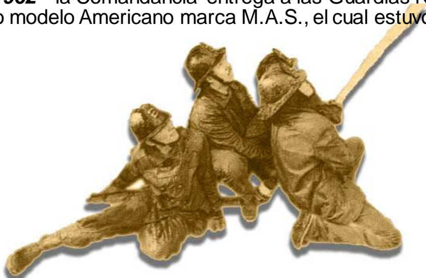
Grupo de Voluntarios Segundinos combatiendo el incendio de La Facultad de Química y Farmacia de la Universidad de Chile ocurrido en el año 1992.

En el año 1962 la Comandancia entrega a las Guardias Nocturnas un nuevo Casco de Trabajo modelo Americano marca M.A.S., el cual estuvo en servicio hasta el año 1993 .