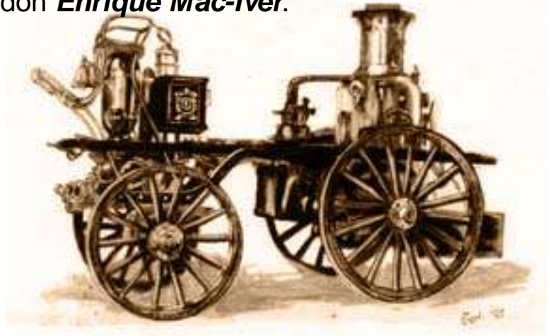
Bomba a Vapor MERRYWEATHER AND SONS 1868 - LONDON "Esmeralda" Alta: 1869. Baja: 1897. Actualmente se encuentra como reliquia en nuestro Cuartel.